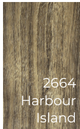
2664 Harbour Island