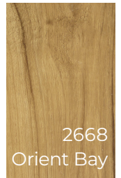
2668 Orient Bay