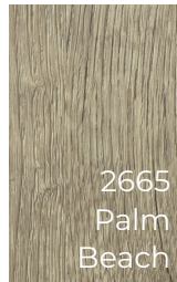
2665 Palm Beach